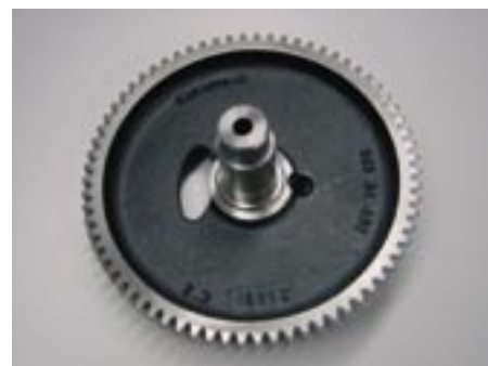
Bild 2: Antriebsrad für einen Bodenverdichter, aus Gründen der Geräuschreduzierung aus ADI (EN-GJS-1000-5)

Auch bei nur mittleren Härtewerten zeigen ADI-Werkstoffe einen hohen Widerstand gegen Verschleiß. In Stift-Scheibe-Versuchen wurde der Materialabtrag unterschiedlicher Werkstoffe er-