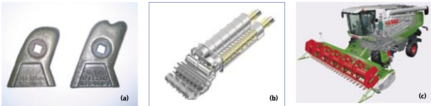
Bild 3: Die Verschleißfinger (a) kommen in den Abscheiderotoren (b) eines Mähreschers (c) zum Einsatz; Vergleich des Verschleißverhaltens bei der Reisernte für identische Verschleißbedingungen: (a) links Verschleißfinger aus EN-GJS-600-3, (a) rechts aus karbidischem ADI (CADI)

mittelt und in Abhängigkeit von der Härte der Werkstoffe aufgetragen. Zwar gilt innerhalb einer Werkstoffgruppe, dass der Werkstoffverschleiß mit steigender Härte sinkt. Eine Übertragbarkeit des Verschleißverhaltens auf andere Werkstoffe gleicher Härte ist jedoch nicht möglich. Bei gleicher Härte zeigen Werkstoffe ganz unterschiedlichen Materialabtrag.